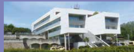
Direction régionale des ASF à Biarritz