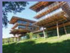
Quiksilver à St-Jean-de-Luz