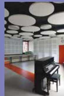
Maison de la Musique à Montardon

Créée par le CAUE 64 sur la base d'un travail de connaissance et de valorisation des réalisations architecturales locales des XX° et XXI° siècles, cette exposition présente une vingtaine de bâtiments et projets répartis sur l'ensemble du département. De la cabane d'estive, du foyer rural à la centrale hydroélectrique, une diversité de réalisations remarquables.