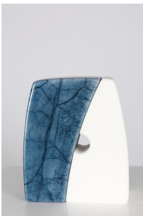
Zohardi IV, Ciel clair Alabastroa, Albâtre 24 x 21 x 8 cm