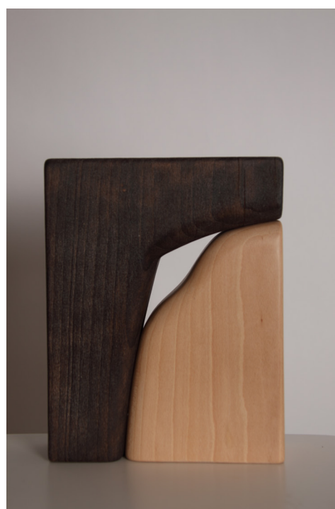
Eguberri IV, Jour nouveau Pagoa, Hêtre 28 x 22 x 7,5 cm