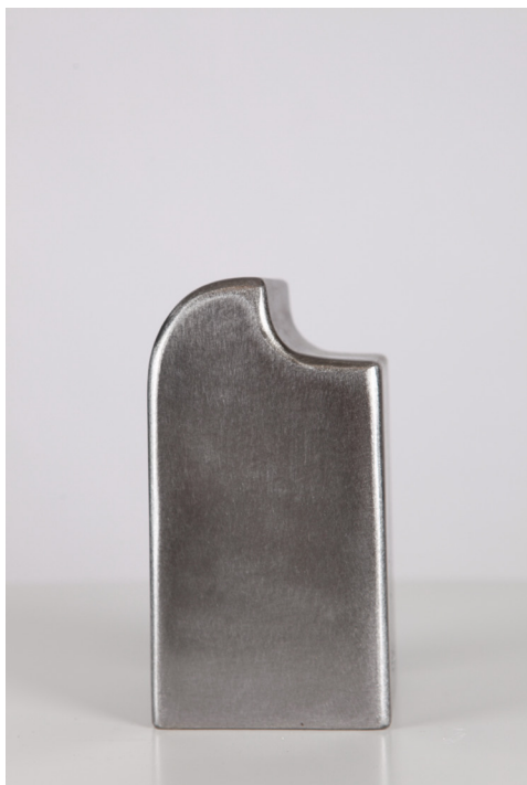
Sakonune IV, Creuset Altzairua, Acier 17 x 9 x 9 cm