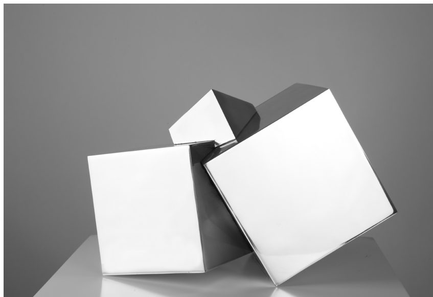
Elkarbarneraketa II - Compénétration II Aluminioa - Aluminium 24,5 x 39 x 22 cm

Larreko Kulturguneko sarrera dohainik izanen da, araberan moldatua, 2019ko urriaren 10etik azaroaren 2ra.