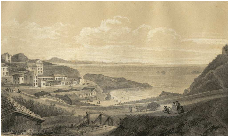
Blanche Hennebutte-Feillet, Biarritz : vue du port vieux et des deux établissements des Bains chauds et des Bains froids , [circa 1850], litografia, Baionako mediateka.