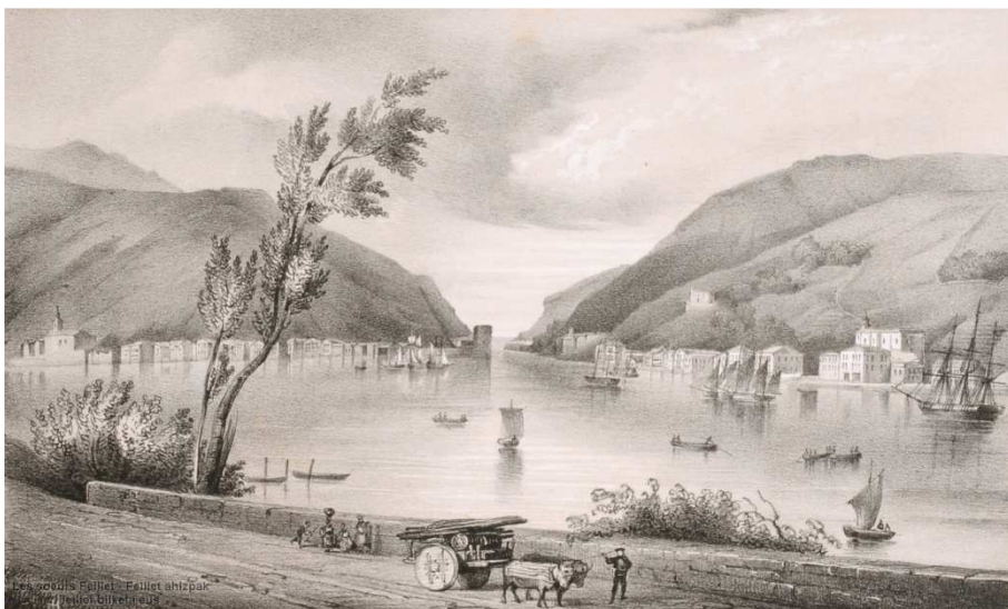
Blanche Hennebutte-Feillet, Port de Passages , litografia, Baionako euskal erakustokia