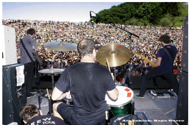
Berri Txarrak - Herri Urrats 2011ko maiatzaren 8an