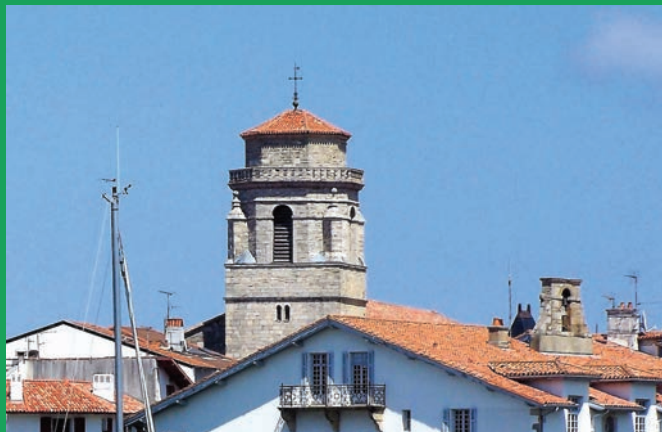
Église Saint-Jean-Baptiste

Saint-Jean-de-Luz et Ciboure appartiennent au réseau national des 184 Villes et Pays d'art et d'histoire.